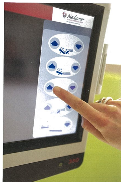
Mit dem über Bluetooth vernetzten Bett werden neue Möglichkeiten erschlossen: Das Bett kann Informationen ans Netzwerk weitergeben.

Durch die zunehmende Integration medizinischer Geräte und Systeme in IT-Netzwerke und aufgrund der europäischen Harmonisierung internationaler Normen zum Risikomanagement (ISO 14971) und zur Systemintegration (IEC 80001-1) stehen Betreiber von Krankenhäusern, medizinischen Versorgungszentren und Gemeinschaftspraxen vor großen Veränderungen. Die Philosophie der Systemverantwortung hat sich grundlegend geändert. War in der Vergangenheit primär der Hersteller für den störungsfreien Betrieb und Interoperabilität der Geräte untereinander verantwortlich, so wird in Zukunft der Betreiber des Systems in die Pflicht und die daraus abzuleitende Haftung genommen. Um im klinischen Alltag Medizinprodukte, die nicht für den interoperablen IT-Netzbetrieb zugelassen sind, in ein übergreifendes IT-Netzwerk zu integrieren, werden oft improvisierte Anpassungen von Betreibern in Eigenverantwortlichkeit realisiert. Derartige Anwendungen außerhalb des bestimmungsgemäßen Gebrauchs verlieren jedoch die vom Hersteller erklärte Richtlinienkonformität. Die beteiligten Produkte können somit ihre CE-Zulassung verlieren, womit der Betreiber die Alleinverantwortung für die auftretenden Risiken übernimmt. Mit der Veröffentlichung der IEC 80001-1 wird ein allgemeingültiger Lösungsansatz auf Basis eines übergreifenden Risikomanagements vorgestellt. Diesen Lösungsansatz wählten die Projektbeteiligten nach eigener Darstellung, um die Bluetooth-Anbindung der Klinikbetten zu realisieren.