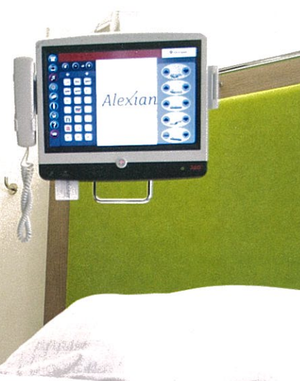
Im Krankenhaus Maria-Hilf in Krefeld sind 76 Betten mit der integrierten Vernetzung ausgestattet.

Alexianer Krefeld GmbH Krankenhaus Maria Hilf Frank Jezierski Dießemer Bruch 81 47805 Krefeld Tel.: 0 21 51 / 3 34-0 info@alexianer-krefeld.de www.alexianer-krefeld.de